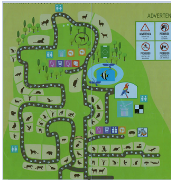
Figura 2. Mapa de Zoo Mundo ( www.zoomundoaqp.com.pe )

Nota: Tomado del tríptico Parque Albergue Zoo Mundo, Paucarpata–Arequipa.