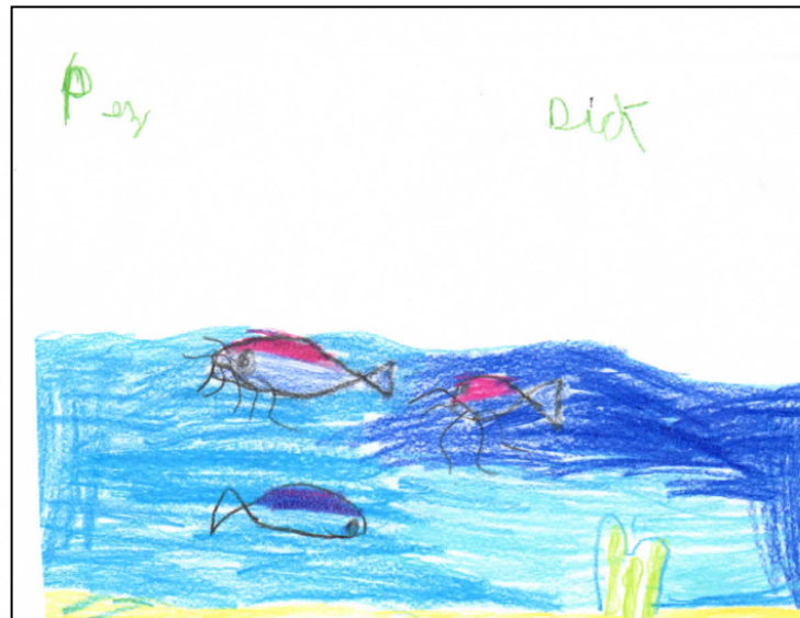
Figura 3. Representación gráfica de un alumno

Inmediatamente, se dio la actividad vinculada con el área de Arte y Cultura, representaron gráficamente los sucesos aleatorios vividos en el Parque Albergue Zoo Mundo de Arequipa usando las nociones suceso posible y suceso imposible (ver Figura 3).