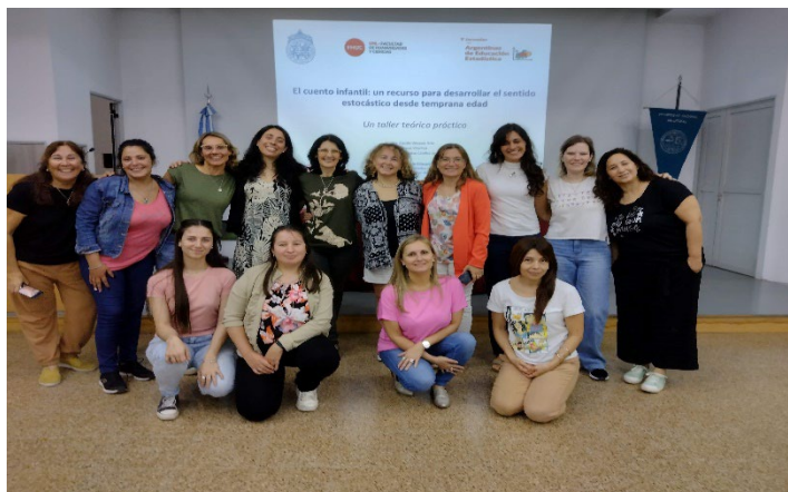
Figura 1. Grupo Estocástic@s y algunos asistentes a V JAEE

Desde el año 2019 y de manera anual, el Grupo Estocástic@s (Figura 1), de la Facultad de Humanidades y Ciencias de la Universidad Nacional del Litoral, lleva adelante la organización de las Jornadas Argentinas de Educación Estadística. La quinta edición de dichas jornadas, se realizó de manera presencial, entre el 9 y 11 de noviembre de 2023, en la ciudad de Santa Fe (Argentina).