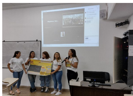
Figuras 6 y 7. Participantes y asistentes conversatorio sobre Competencia Internacional de Alfabetización Estadística