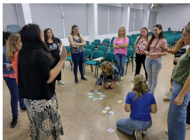
Figuras 4 y 5. Asistentes al taller: El cuento infantil: un recurso para desarrollar el sentido estocástico desde temprana edad

Y, por último, los conversatorios, que son las instancias que distinguen a las Jornadas Argentinas de Educación Estadística, porque se han erigido en momentos de intercambio en los que se escuchan las voces, tanto de docentes de distintos niveles como de los estudiantes. Estos espacios, desde 2019, han sido valorados de manera positiva por los asistentes y por los participantes, ya que permiten poner en evidencia problemáticas, necesidades y propuestas para trabajar de manera conjunta, investigadores, docentes y